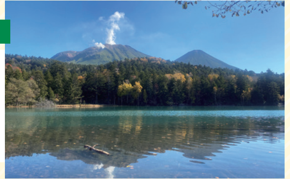
オンネトー 住所：足寄郡足寄町茂足寄 (冬期間は積雪により通行止め)

別名「五色沼」と呼ばれる北海道三大秘湖オンネトーに到着。「オンネトーブルー」にうっとり。大きな森と山に囲まれ、その大自然に圧倒されます。