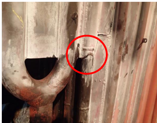
1号機：ボイラー管損傷状況