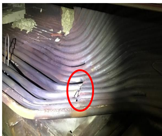
2号機：ボイラー管損傷状況①