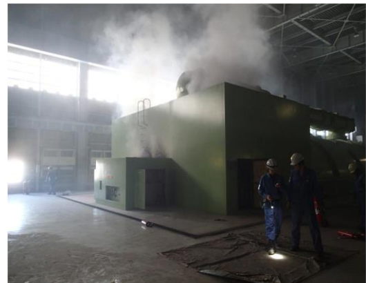
4号機：タービン出火状況