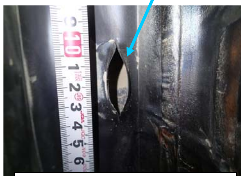
炉炉出口部側壁管 破孔状況 長さ約 35mm × 幅約 15mm