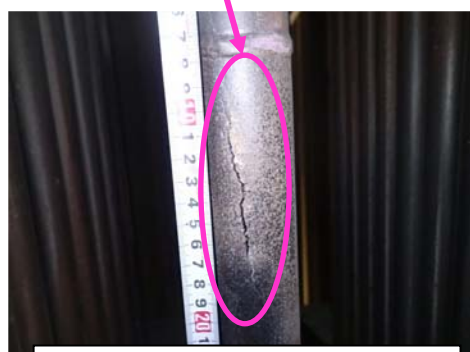
再熱器管 破孔状況 表面き裂約 80mm、貫通き裂約 60mm