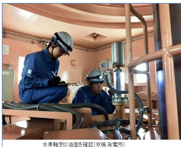
水車軸受の油面を確認(京極発電所)

電力の安定供給を継続するため、各水力発電所では定期巡視・点検に加え、臨時巡視を実施しています。臨時巡視では、水車発電機や制御装置、取水設備の状況を直接確認し、さらに Web カメラにより遠隔からも状況確認するなど、監視の強化を図っています。