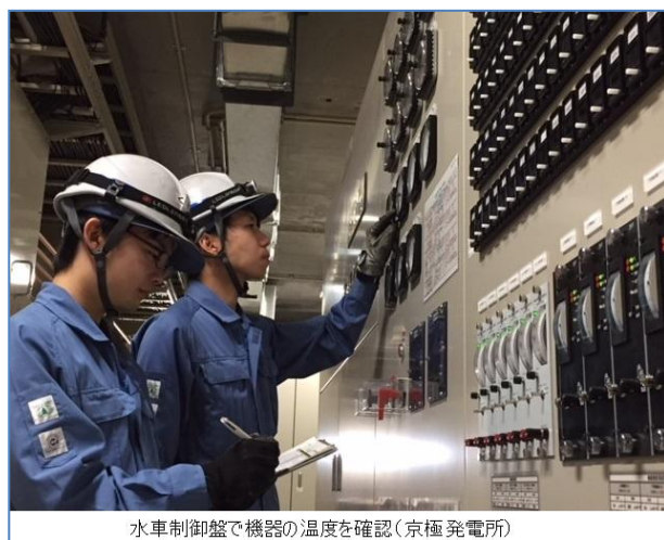
水車制御盤で機器の温度を確認(京極発電所)