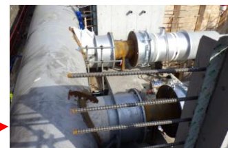
写真1(水圧鉄管に分岐配管取付状況)