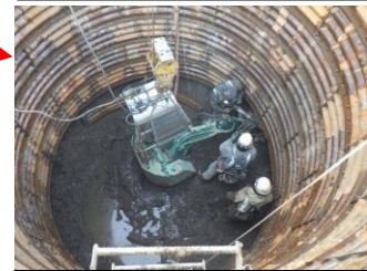
写真3(放水路接続柵の掘削工事状況)