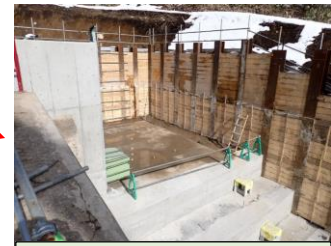
写真2(コンクリート打設状況)