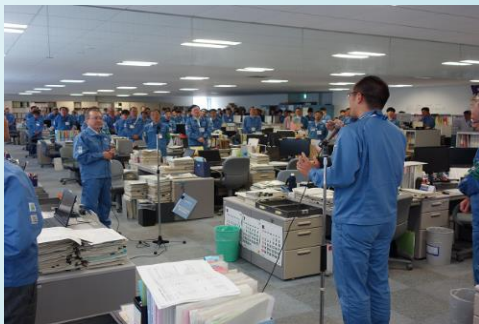
社長による泊発電所での訓示 所員との意見交換