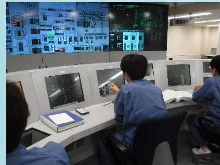
発電所運転員のシミュレータ訓練