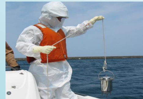
放射線管理要員の海上サンプリング