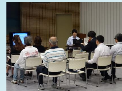
ほくでんエネルギーキャラバン開催状況