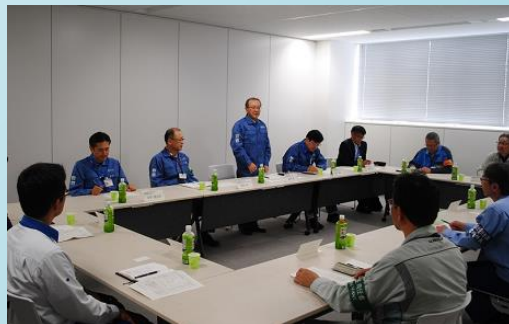
社長と協力会社所長との意見交換