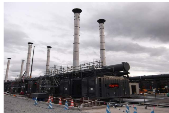
【緊急設置電源（南早来発電所）】