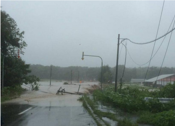
芽室町 配電柱倒壊の状況 (8月30日17時)