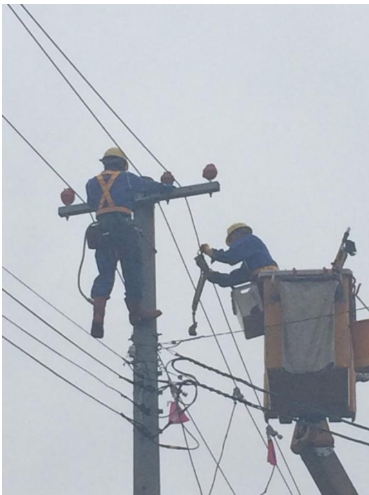
室蘭市築地町 配電線への 飛来物除去後の断線復旧作業 (8月31日14時)