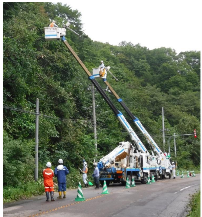
函館市石倉町 配電線への接触樹木 除去（伐採）作業 (8月31日7時)

※このほかにも北海道各地で設備被害が多数発生しており、懸命に復旧作業を続けています。