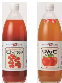
JA新おたる ジュース2本セット 2,000 ポイント