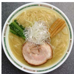
函館まる塩ラーメン 450 ポイント