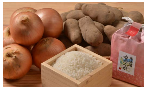
【季節限定】 北海道秋の味覚セット 4,000 ポイント