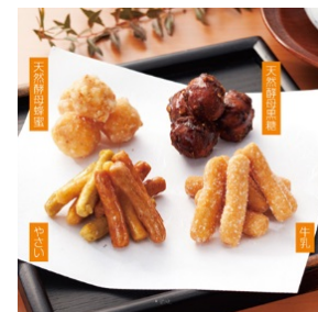
北かり 北海道かりんとう 4種セット 1,950 ポイント