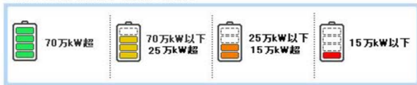
でんき予報(供給予備力)の凡例