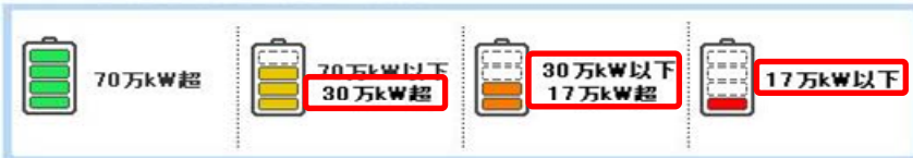
でんき予報(供給予備力)の凡例